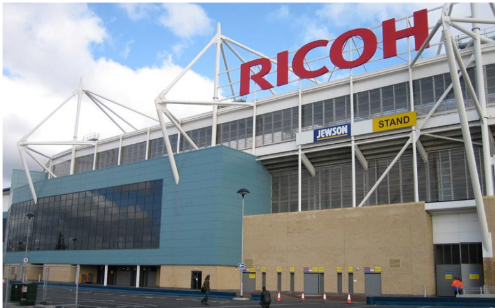
Ricoh Arena er mere end blot hjemmebane for den lokale fodboldklub, Coventry City.

Kommuner og klubber bør indgå i partnerskaber for at skabe bedre byggerier af stadionanlæg og halanlæg til topidræt, mener manden bag Englands nyeste fodboldstadion.