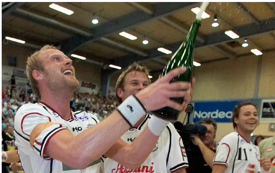
Kolding vandt i sidste sæson det sjette DM-guld siden 1993.